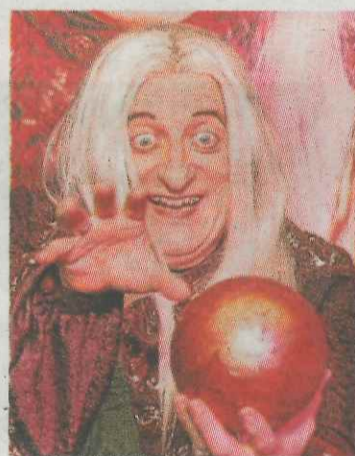
►► Gurruchaga caracterizado.

«Es un musical enorme, como los que se hacen en cualquier otro sitio, solo que en vez de ha-